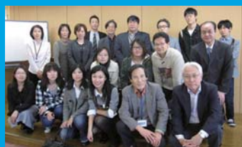
第19回学生選書モニター参加者