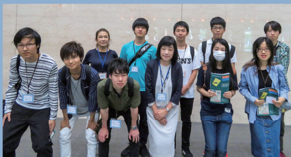
第28回学生選書モニター参加者

6月15日(土)にジュンク堂書店大阪本店にて学生選書モニターを実施しました。選書冊数は全400冊。その中から、既に図書館で所蔵しているものなどを除いた242冊を受け入れました。選ばれた本は学生選書図書コーナーに配架中。図書リストのファイルもありますので、ぜひご活用ください。