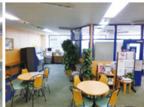
ラウンジ (約144平方メートル) ・テーブル個数: 4個 ・椅子個数: 20脚 ・50インチ液晶テレビ ・DVDプレイヤー